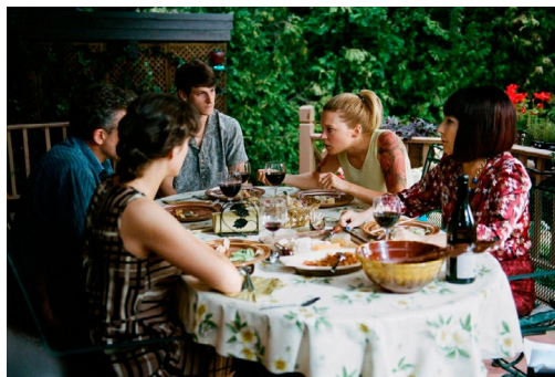
Dans cette histoire adaptée d'une pièce de Jean-Luc Lagarce, le langage exprime aussi une crise existentielle.

Ce huis-clos familial nous plonge dans les pensées de Louis, revenu dans sa ville natale pour annoncer sa disparition prochaine.