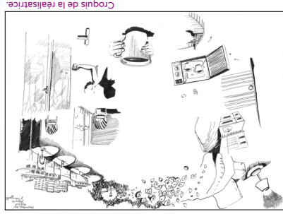
Croquis de la réalisation.

Au début du film, le contour des objets se précise au fur et à mesure et donne l'impression d'être perçu à travers les yeux mi-clos du personnage, émergeant encore de la nuit dans son lit et découvrant peu à peu l'espace autour de lui. Sa voix nous révèle ses pensées intérieures telles qu'elles surgissent dans son esprit, l'une chassant l'autre, allant du questionnement pratique et concret à la réflexion existentielle. Tout se mélange et s'imbrique, comme si cette voix était la radiophonie de son intimité la plus profonde. Le personnage hésite à quitter son nid douillet, tergiversant d'une idée à son appartement. Une fois dehors, tout redevient alors « très calme » dans sa tête. Le titre du film fait alors figure d'oxymore car « le trait » du dessin n'a cessé d'être agité et hésitant, à l'instar du personnage, lui-même placé dans une intranquillité