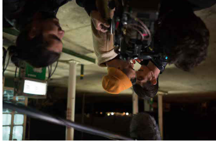
Sur le tournage du film avec le chef opérateur Cioigos Valsamis à la caméra.