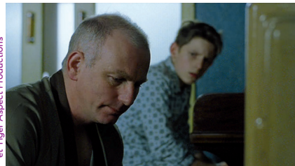
De l'incompréhension entre un père et son fils, mais de l'amour malgré tout.