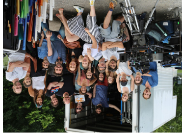
L'équipe sur le tournage du film.