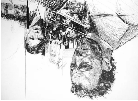
Un dessin préparatoire rassemblant certains éléments du film. © Jean-Baptiste Durand