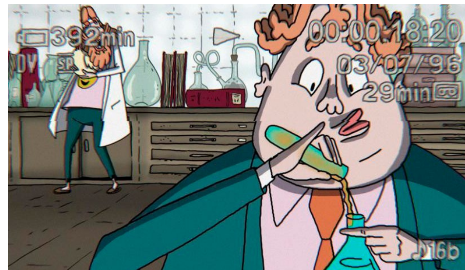
Bernard et Michel, deux frères incarnant deux conceptions différentes et difficilement conciliables de l'alimentation.

Comment le film s'amuse-t-il à détourner l'esthétique des films à grand spectacle et dans quel but ?